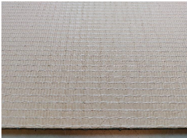
Figure 1: Picture of the received sample (surface)